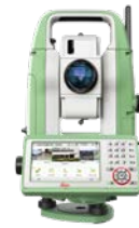
Leica FlexLine TS10