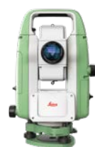
Leica FlexLine TS03