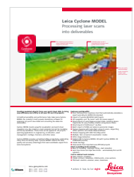
Leica Cyclone MODEL