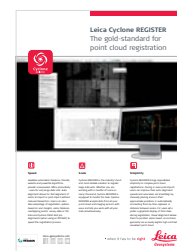
Leica Cyclone REGISTER