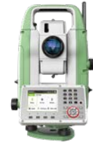
Leica FlexLine TS07