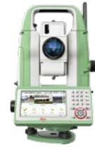
Leica FlexLine TS10