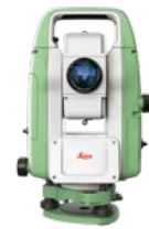
Leica FlexLine TS03